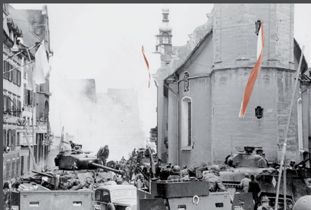
Bregenz, 1. Mai 1945: Inmitten rauchender Ruinen weht vom Rathaus wieder eine rot-weiße Fahne.