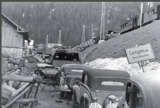
Langen am Arlberg, 6. Mai 1945: Strandgut einer Fluchtwellen.