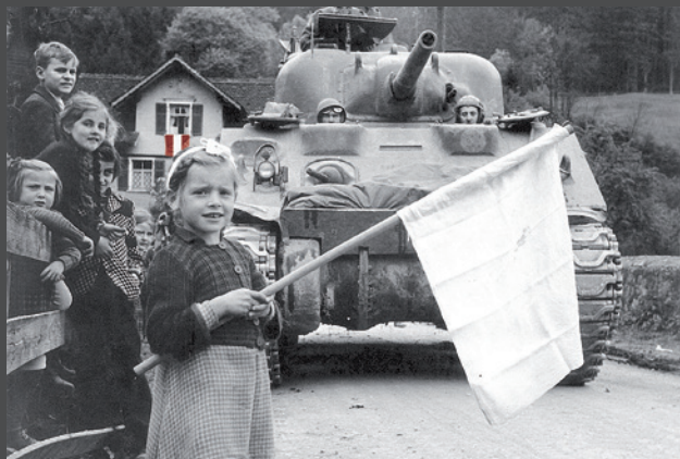
Altenstadt, 3. Mai 1945: Der Schein trägt. Die französisch- marokkanischen Truppen müssen sich gegen zum Teil heftigen Widerstand in Richtung Arlberg vorkämpfen.